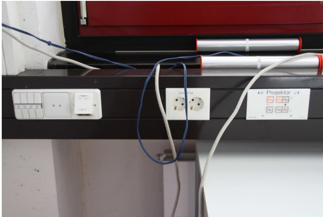
Raumfunktionen und Tastenbedienfeld