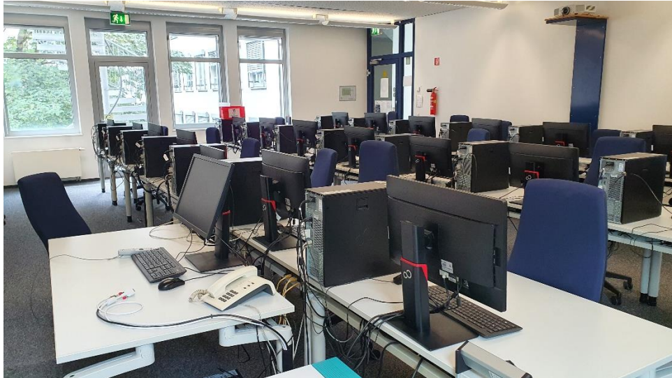
Raumansicht von Dozent