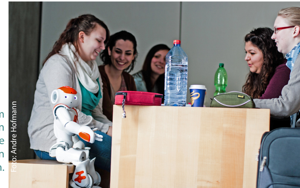
In Mannheim lernen Studierende in kleinen Arbeitsgruppen.