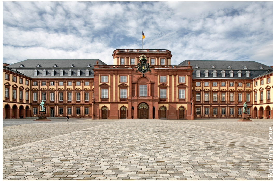
In Mannheim studiert man im Quadrat: So werden dort die Adressen in der Innenstadt angegeben. In der City ist auch das Mannheimer Barockschloss zu finden – der Sitz der Universität.

Wirtschaftsinformatiker vereinen komplexes Informatikwissen und fundierte Branchenkenntnisse. Sie analysieren betriebswirtschaftliche Vorgänge und kommunizieren zwischen Management und IT. Wirtschaftsinformatiker arbeiten in Softwarefirmen, im Web-Design, als IT-Consultant oder Web-Developer. Und das meist weltweit. So tragen Wirtschaftsinformatiker einen wesentlichen Teil zum wirtschaftlichen Erfolg eines Unternehmens bei.